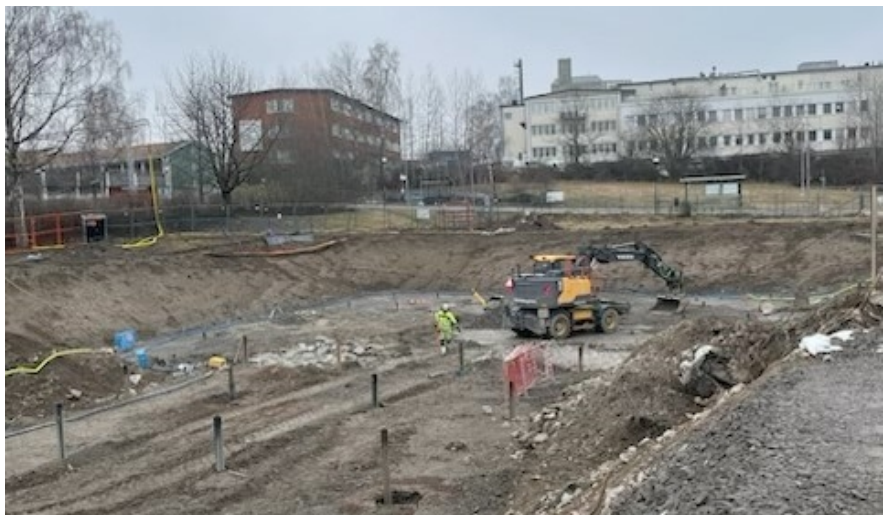
Översiktsvy över badområde och pågående arbeten (illustration: Nivå landskapsarkitektur).

Projektet medför en bättre arbetsmiljö samt fler funktioner för besökare och en förbättrad helhetslösning för anläggningen. Befintliga teknikutrymmen för vattenrening ersätts och utökas med målet att öka kapaciteten och minska driftskostnaderna. Anläggningen kommer att få tempererade bassänger och samtliga bassänger får stålutförande. Barnbassängen ersätts i ett något justerat läge. För att minimera kostnadsdrivande etappindelningar och provisoriska lösningar under byggtiden kommer badet att vara